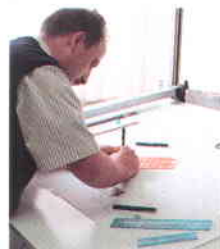
Realización de Proyectos