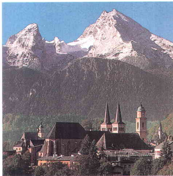
A la izquierda, el Ayuntamiento de Bremen y la catedral de San Pedro. A la derecha, una vista de la localidad de Berchtesgaden, en el Estado de Baviera.

Este derecho está respaldado por el artículo 28 de la Constitución Federal que reconoce que “los Municipios deben tener garantizado el ejercicio del derecho a gestionar todos sus asuntos bajo su propia responsabilidad y dentro del marco de la legalidad. Las Agrupaciones Municipales tienen, igualmente, derecho a la autonomía, dentro de los límites de su competencia y conforme a las disposiciones legislativas” .