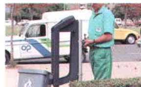
Reposición y Mantenimiento