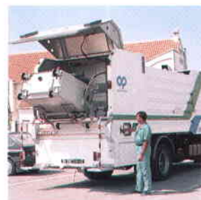
Lavado y Desinfección