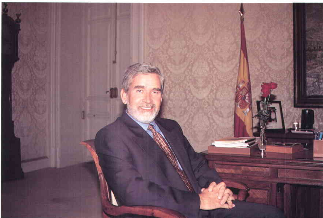
Joan Lerma, Ministro para las Administraciones Públicas