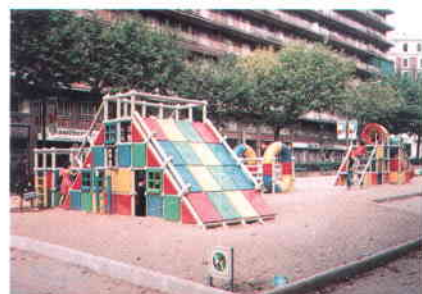
Areas de Juego. LUDOPARC

Valencia (Catarroja) Tel. (96) 127 06 00